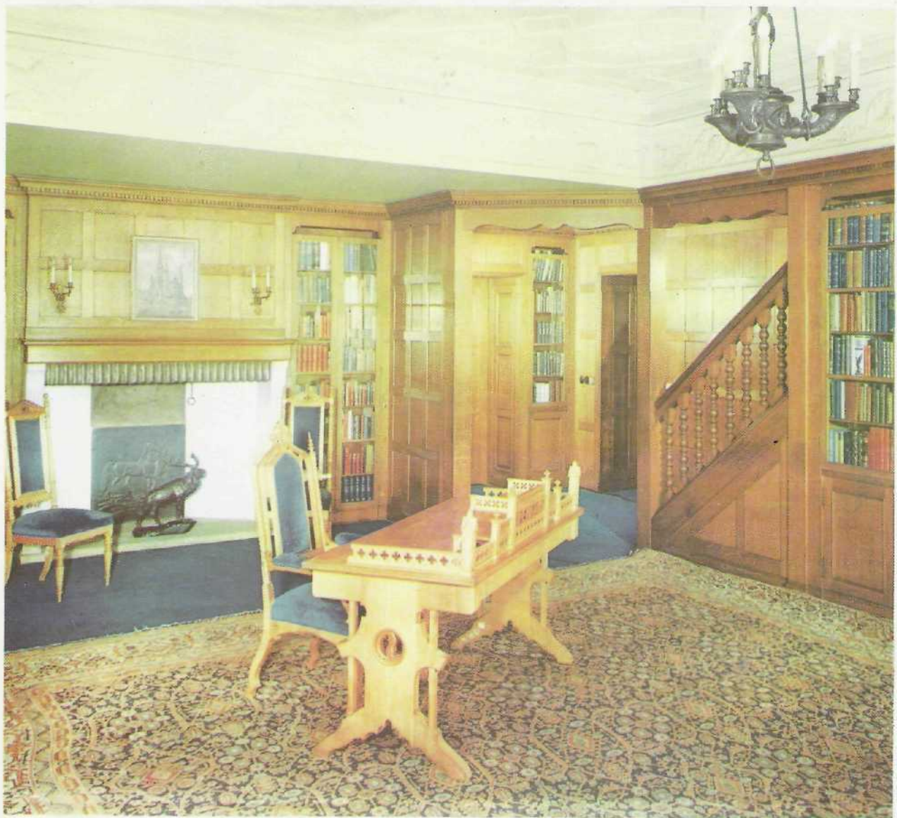
Рабочий кабинет английской делегации