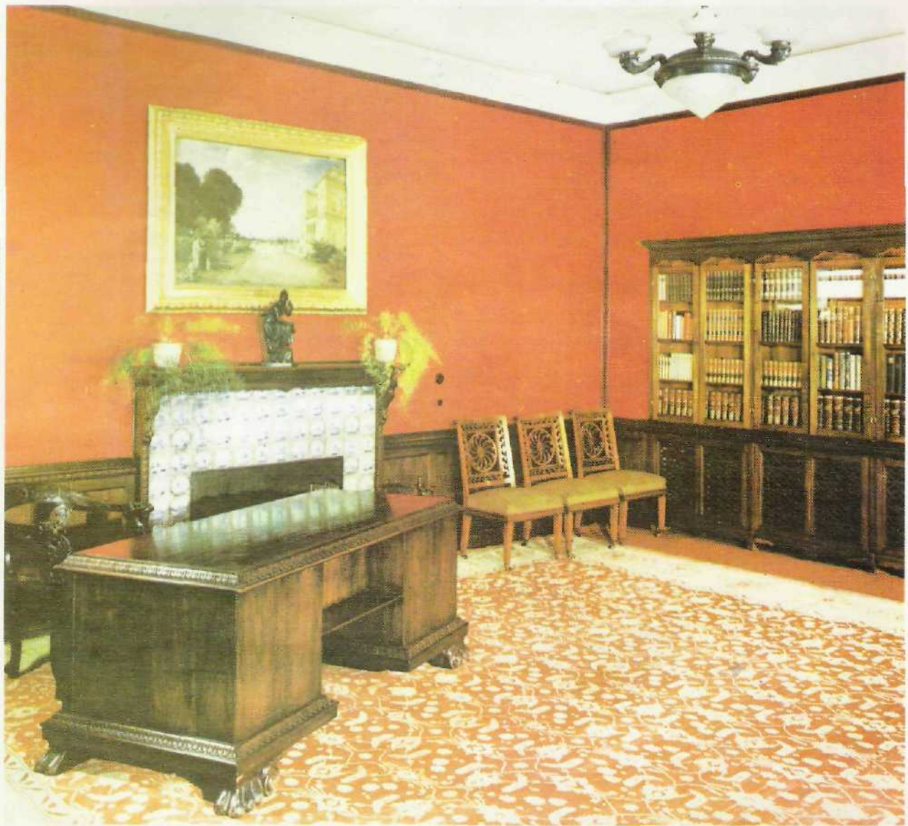
Рабочий кабинет советской делегации